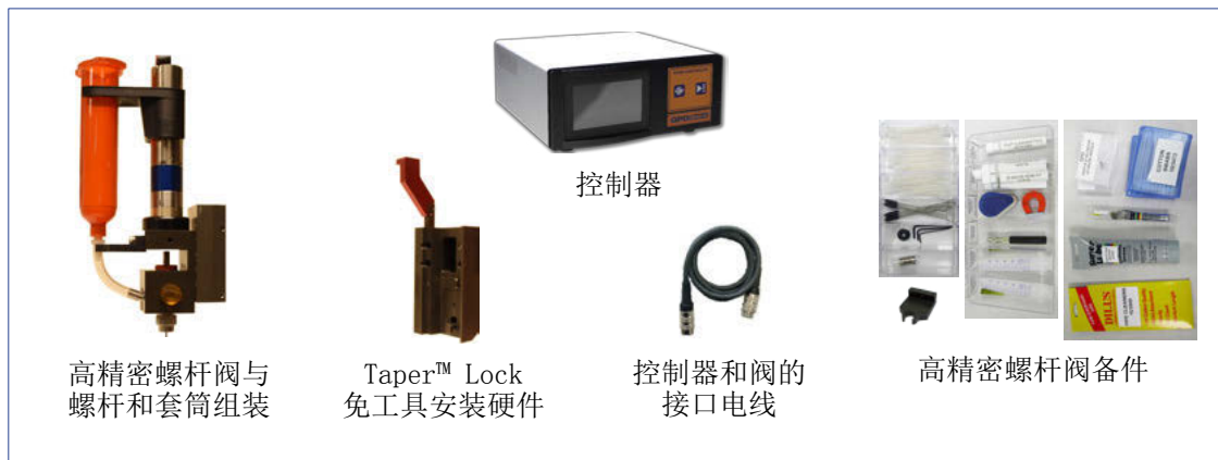
高精密螺杆阀与 螺杆和套筒组装