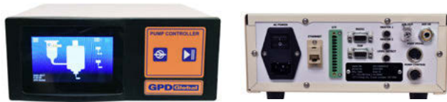
图2：控制器前后视图

阀的控制参数有加速度，减速度，旋转速度和旋转量（仅用于点）。控制器上的触摸屏非常直观，透过通用的符号，图片或数字进行编程。该控制器也可以连接到电脑上进行远程编程，使这个综合控制器可以满足所有精密螺杆阀的需求。客户可以独立设置不同的参数，通过系统的输入引用。图3解说如何把螺杆阀整合到第三方的点胶系统上。